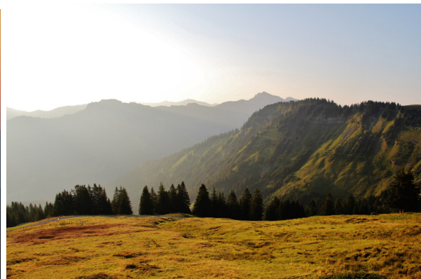
Blick Richtung Hoher Freschen