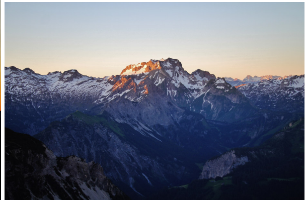
Blick Richtung Rote Wand