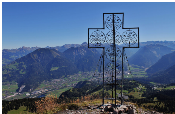
Mondspitze (1.967 m)