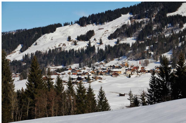
Blick nach Sibratsgäll

Nach einer kleinen Pause stampfen wir ein wenig oberhalb von unserem Hinweg zurück. Kommen bei der Hintere Leugehalpe (940 m) mit der kleinen Kapelle vorbei und überqueren wieder die Subersach. Ab der Ifer Krähenbergalpe (970 m) gehen wir ein kleines Stück auf dem Winterwanderweg. Zeigen bald wieder ab und wandern wieder querfeldein zurück zu unserem Ausgangspunkt.