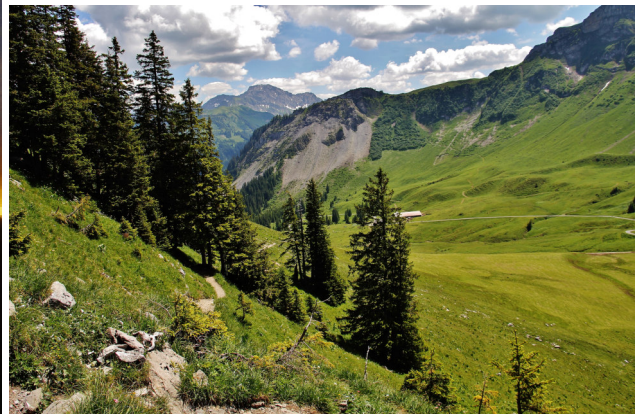
und Abstieg durch die Alpwiese