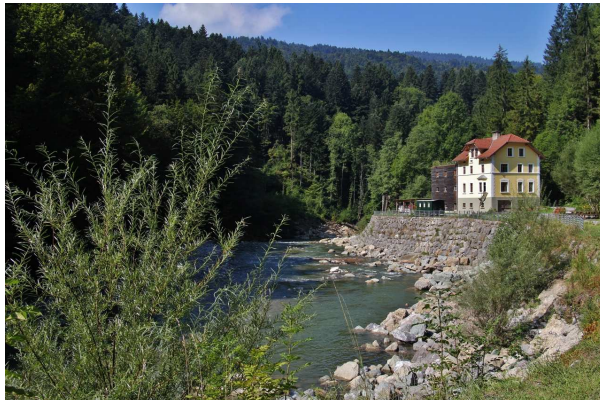
Alter Bahnhof Lingenau

Von Lingenau, St. Anna (668 m) gehen wir auf der alten Lingenauer Straße zum alten Bahnhof. Gehen auf der alten Bahntrasse bis über die Subersach und biegen links ab. Auf einem alten Weg, der nicht gekennzeichnet ist, steigen wir hinauf zum Hoftobelweg. Wildromantisch führt der Weg am Hang entlang. Die Stille wird durch das Klopfen des über hundert Jahre alten Brunnens unterbrochen. Diese Wasserpumpe arbeitet nach einem alten Funktionssystem, ohne jede Fremdenergie, nur mit der Kraft des Wasserdruckes. Unterhalb der Pumpe ist eine Wassertrete (kleine Kneippanlage), wo wir eine kleine Pause machen. In östlicher Richtung gehen wir weiter bis zur Abzweigung, dort biegen wir Richtung Norden ab. Der Weg führt hinunter, an einem kleinen See vorbei, zur Drahtseilbrücke. Diese überqueren wir einzeln und wandern wieder hinauf zum Lehrpfad Quelltuff. Der Lehrpfad führt über einen gut begehbaren Kiesweg mit Holzstegen und -treppen. Wir haben Zeit, um dieses Naturjuwel in Ruhe anzuschauen und zu bewundern. Über Heselhalden (618 m) kommen wir wieder zu unserem Ausgangspunkt.