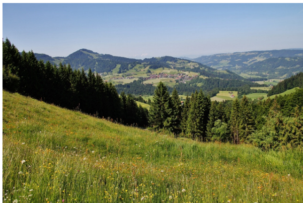
Blick v. Hündlekopf

Danach steigen wir hinauf und biegen vor der Alpe Neuschwend rechts ab und wieder hinunter zur Weißbach mit den eindrucksvollen Buchenegger Wasserfällen. Nach der Besichtigung der oberen und unteren Wasserfälle steigen wir auf der gegenüber liegenden Seite recht steil hinauf zum kleinen Parkplatz. Rechts gehen wir weiter und biegen nach einigen hundert Metern links hinauf zum Hündlekopf (1.112 m) und weiter zur Bergstation (1.051 m).