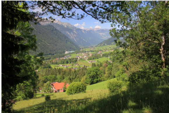
Blick ins Klostertal

Der Abstieg erfolgt auf derselben Route bis zum Fahrweg, dort links abwärts und an dem nächsten Wegweiser rechts beim Gatter hinunter und am Masonbach entlang, durch den Tobel (705 m) nach Innerbraz und auf der Straße nach Außerbraz, zu unserem Ausgangspunkt.