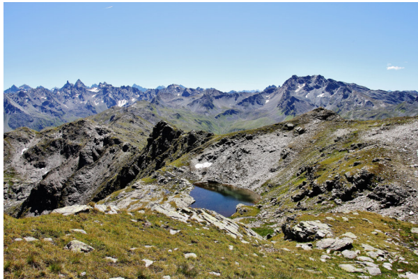
Kleiner See unterhalb der Zwischenspitze

Zurück gehen wir ein Stück wie Aufstieg, biegen jedoch links, zum Heimbühel Joch (2.495 m) ab. Vom Heimbühel Joch wandern wir in Kehren hinunter zur Vergaldaalpe. Dabei haben wir einen majestätischen Blick ins Vergalda Tal. Von der Alpe wandern wir wieder auf dem Güterweg zurück zum Ausgangspunkt.