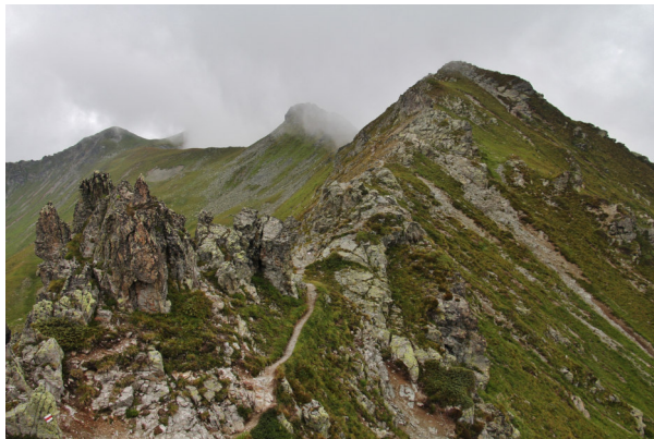
Gratweg zum Riedkopf (im Nebel)

Nach einer entsprechend langen Pause gehen wir bis zur Abzweigung zurück und steigen in östliche Richtung, durch Berg- und Alpwiesen ab. Dabei haben wir eine tolle Sicht ins Vergadatal. Über Täscher (1.925) und Gargellner Alptobel kommen wir wieder zu unserem Ausgangspunkt.