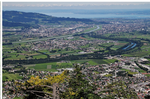
Blick vom Kapf