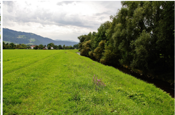
und Österreichische Seite