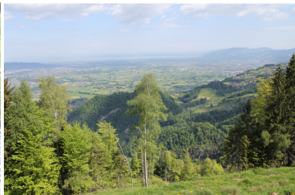
Blick bis zum Bodensee