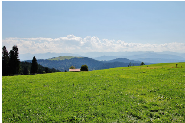
Blick zum Hirschberg und

Nach einer angemessenen Pause gehen wir über die Hochberg Alpe (1.062 m) hinunter nach Schüssellehen (969 m) und weiter nach Mühle (890 m). Dabei haben wir eine freie Sicht auf den Bodensee. Auf einem „Bänke“ können wir das atemberaubende Panorama genießen. Durch Ried (869 m) und am Riedbach (850 m) entlang, kommen wir nach Kurlismühle (851 m) und erreichen über Weienried (835 m) wieder unseren Ausgangspunkt.